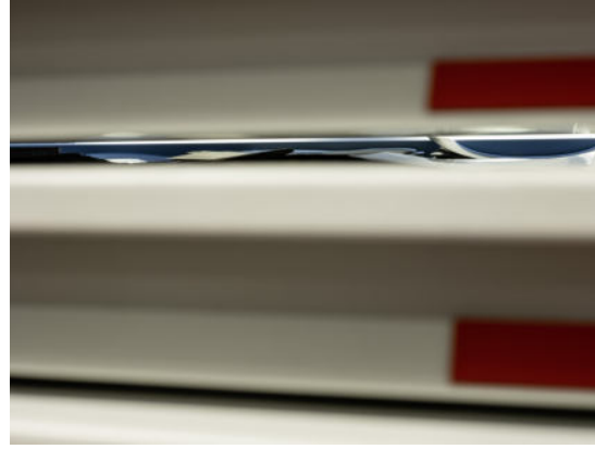
Deichtorhallen Hamburg: PHOXXI Christoph Irrgang, aus der Serie: Behind the Scenes , 2021 © Christoph Irrgang.