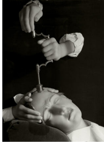
Museum für Kunst und Gewerbe Hamburg Herbert List, Trepanation , 1944/46, Silbergelatinepapier, 300 x 228 mm, Münchner Stadtmuseum