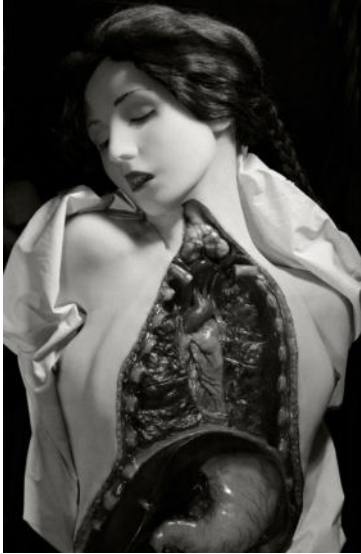
Museum für Kunst und Gewerbe Hamburg Herbert List, Belehrender Einblick in den Brustkorb , 1944, Silbergelatinepapier, 296 x 191 mm, Herbert List Nachlass Hamburg © Magnum Photos / Herbert List Nachlass Hamburg.