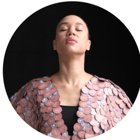
Museum für Hamburgische Geschichte Aufnahme aus Macht. Mittel. Geld.