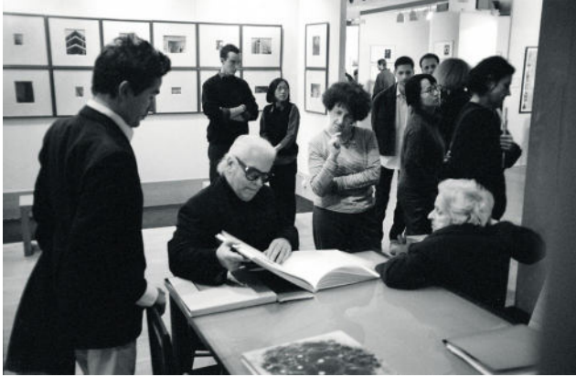
Deichtorhallen Hamburg: PHOXXI Denis Brudna, aus der Serie: Paris Photo © Denis Brudna.