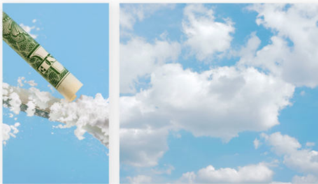
Hamburger Kunsthalle Viktoria Binschok, Lines & Clouds , 2020, Digitaler C-Print, 117 x 69 cm / 117 x 130 cm.

Ein Publizieren der Pressebilder in Social-Media-Kanälen bedarf stets der Erlaubnis der Urheber*innen.