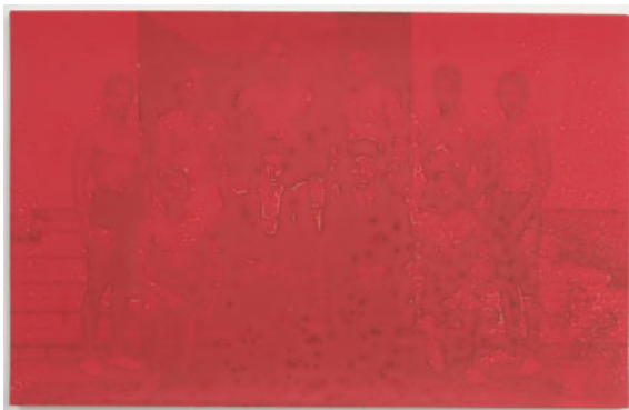
Deichtorhallen Hamburg: Halle für aktuelle Kunst Raed Yassin, The Company Of Silver Spectres , 2021. Acryl-Sprühfarbe auf gefundener Fotografie. Mit freundlicher Genehmigung durch den Künstler.

Ein Abdruck der Pressebilder in Medienberichten ist nur und ausschließlich mit Berichterstattung zur Triennale und den genannten Ausstellungen erlaubt. Voraussetzung für die gebührenfreie Nutzung ist die Beachtung der u.g. Bildnachweise.