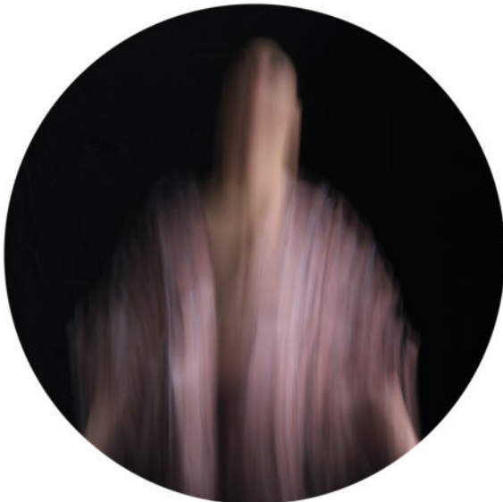
Museum für Hamburgische Geschichte Aufnahme aus Macht. Mittel. Geld. © Chris Schwagga, SHMH-MHG (1).