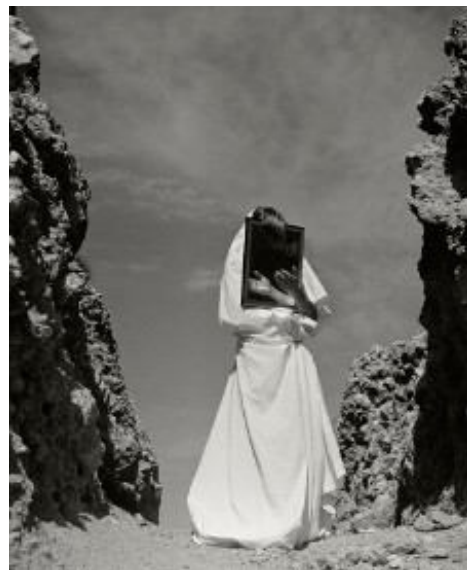
Bucerius Kunst Forum Herbert List, Geist des Lykkabettos , Athen 1937, Münchner Stadtmuseum, Sammlung Fotografie, Archiv List © Herbert List Estate / Magnum Photos / Agentur Focus.