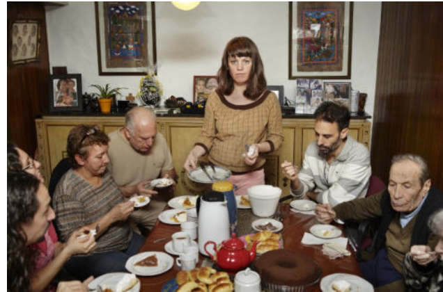
Deichtorhallen Hamburg: Hall for Contemporary Art Cecilia Reynoso, Gaviota serving desert , aus der Serie The Flowers Family , 2014.