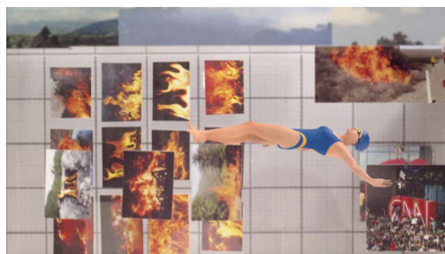
Hamburger Kunsthalle Sara Cwynar, Glass Life (Film-Still) , 2021, 6-Kanal-Video (2k) mit Ton, 19:02 min. / Maße variabel

Ein Publizieren der Pressebilder in Social-Media-Kanälen bedarf stets der Erlaubnis der Urheber*innen.